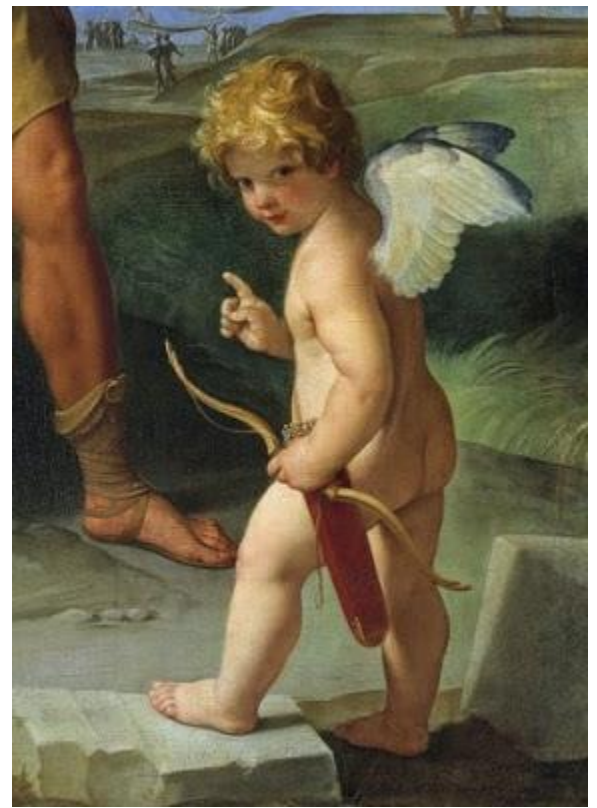
Détail de L'enlèvement d'Hélène , Guido Reni, 1631