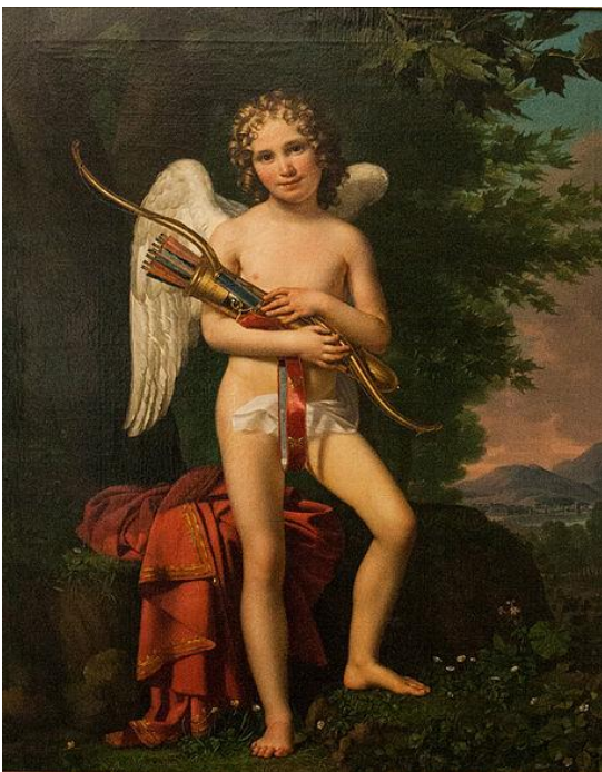
Eros, Paelinck, 1820